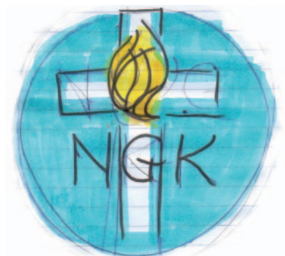
Een 'gevlamde' voorstudie.