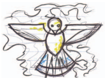
Een voorstudie met een duif.

Het verschil met het oude logo is enorm.