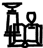
1962 - Logo Nederlands Gereformeerde Kerken