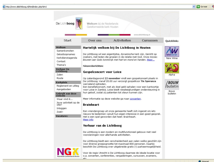
Voorbeeld homepage website NGK Houten