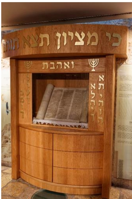
De nieuwe vitrinekast met thorarol

Ook mochten we de mooie vitrinekast bekijken die met financiën van Yachad werd gerealiseerd. Daarin wordt een kostbare Thora rol tentoongesteld die de Reichskristallnacht in Duitsland heeft overleefd. Links en rechts van de rol staat in het Hebreeuws: 'Heb de HEER uw God lief boven alles en heb uw naaste lief als uzelf'.